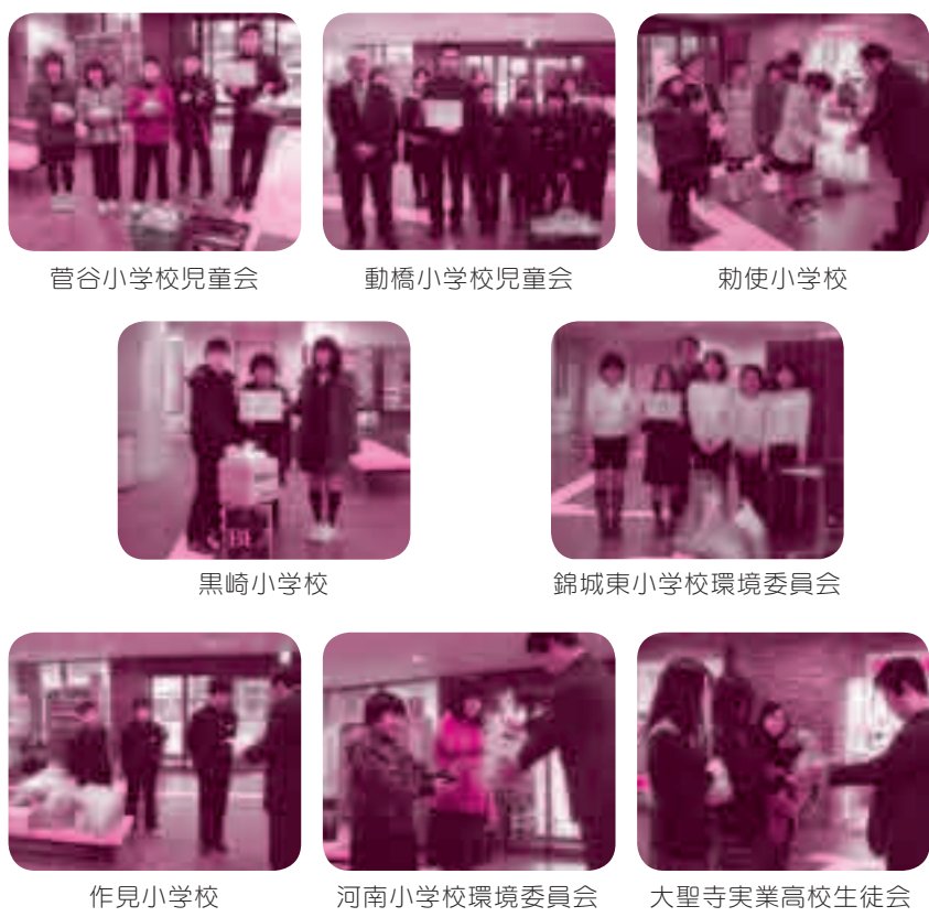
菅谷小学校児童会

業への協力などです。決して押し付けや強制的な活動ではありません。個人ができる範囲で行う無償のボランティアです。平成23年度は市内で三三〇名が委嘱されました。各町区長並びに担当民生委員児童委員が御相談の上推薦くださるよう宜しくお願いいたします。