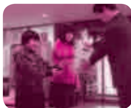
河南小学校環境委員会